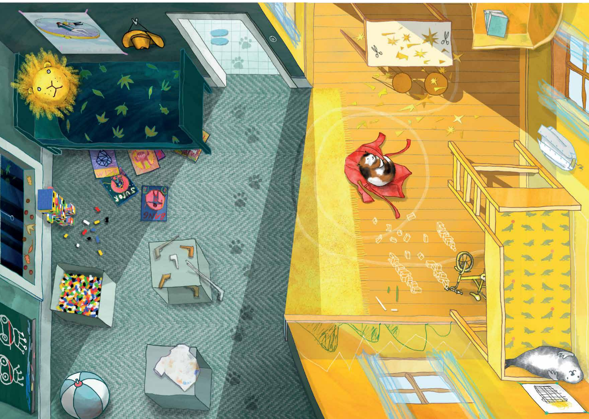
Illustration aus: Anne Rieker/Sabine Heine – Das Gute daran. Bei Mama und bei Papa

01.01. Neujahr, 06.01. Heilige Drei Könige, 14.02. Valentinstag, 28.02. Faschingsdienstag, 01.03. Aschermittwoch